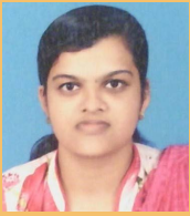
■ റിനോ -MFL

ആദ്യം ഒരു കപ്പ അമൃതംപൊടി, കാൽ ടീസ്പൂൺ സോഡാപൊടി, ഒരു നുള്ള ഉപ്പ് ഇവ മൂന്നും കൂടി യോജിപ്പിച്ച് ഒരു അരിപ്പയിൽ മൂന്നു തവണ അരിച്ചെടുക്കാം. അത് മാറ്റി വെച്ചശേഷം അര ഗ്ലാസ് പഞ്ചസാര അതിലേക്ക് ചേർത്ത് ഗ്രാമ്പൂ, ഏലക്ക എന്നിവ ഇട്ട് പൊടിച്ചെടുക്കാം. അതിൽ കാൽ ഗ്ലാസ് സൺ ഫ്ലവർ ഒായിൽ, ഒരു മുട്ട ഇവ ചേർത്ത് ഒന്നുകൂടി യോജിപ്പിക്കാം. എടുത്തു വച്ചിരിക്കുന്ന അമൃതംപൊടി കുറച്ചു വീതം ചേർത്ത് ഘട്ടം ഘട്ടമായി യോജിപ്പിക്കാം. അത് മാറ്റി വെച്ച ശേഷം അടി കട്ടിയുള്ള ഒരു പാത്രം വെച്ച് ചൂടാക്കുക. ചൂടായശേഷം കേക്ക് ബേക്ക് ചെയ്യാനുള്ള പാത്രമെടുത്ത് അതിലേക്ക് നെയ്യ് പുരട്ടി കേക്കിന്റെ മാവ് ഒഴിച്ച് 25 - 30 മിനിറ്റ് വേവിക്കുക. രുചികരമായ അമൃതംപൊടി കേക്ക് തയ്യാർ. എന്തായാലും ഒന്നു പരീക്ഷിച്ചു നോക്കൂ.