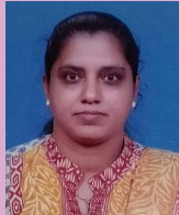
■ ജിജി - MFL

തുടങ്ങണം പ്രാർത്ഥിച്ചോരോ ദിവസവും പാലിക്കണം കൃത്യമായോരോ നിയമവും പാഴാക്കിടല്ലേ സമയത്തെയൊരിക്കലും കൃത്യത എപ്പോഴുമുണ്ടായിരിക്കേണം. വന്ദിച്ചീടേണം നാമോരോരുത്തരെയും യജമാനരാണവരെന്നോർക്കണം ആരായണം അവർതൻ വിശേഷങ്ങളെല്ലാം ഊഷ്മളമാക്കണം ബന്ധങ്ങളോരോന്നും.